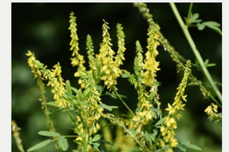
Citroengele- of Akker honingklaver